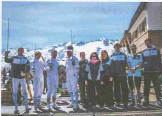
Le groupe AB à Superbagnères.

L'Aviron Bayonnais Escrime organisait son stage d'oxygénation ce week-end pascal dans la station pyrénéenne de Luchon Superbagnères.