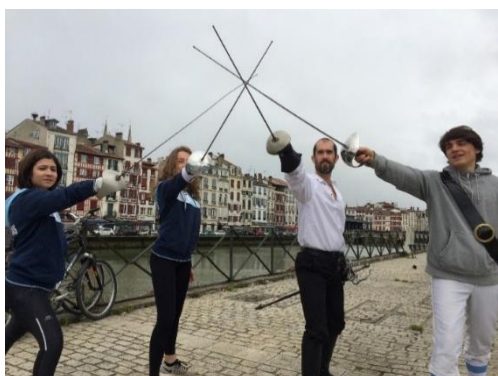
Opérations Bayonne sur le Pont mai 2018 démonstration escrime artistique