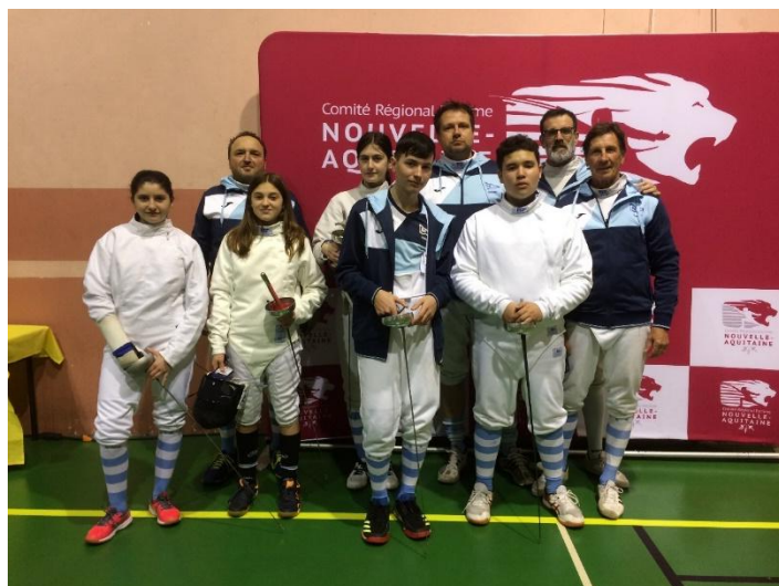
Rencotre interclub à la salled 'armes F. Kayser . Les équipes de l'AB M15 et vétérans aux championnats NA le 9 02 2020 à Talence