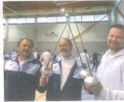
Match du challenge de Bayonne : Landrin AO contre Capoville AB.

Ce challenge compte sur une forte mobilisation du partenariat avec le principal, la Ville de Bayonne dont ses services mettent à disposition le palais des Sports du Lauga. Intersport Bayonne le Forum offrant une grosse dotation en chèques cadeaux pour les podiums et les autres partenaires Aubard charcuterie, l'Etablissement Français du Sang, Optique St-Esprit à Bayonne ou Peytavin Sports.