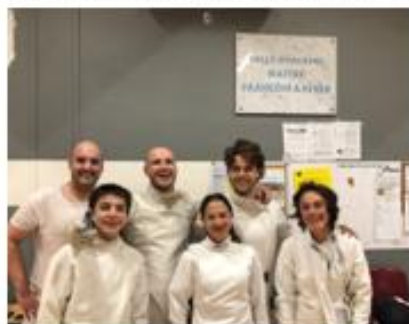
Nos jeunes adultes de la section AB escrime dans la salle d'armes François Kayser au Palais des Sports du Lauga